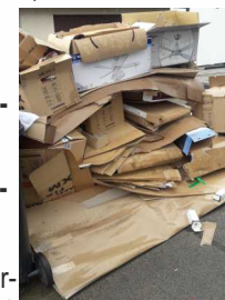
Viel zu viel für die Abfuhr! Solche Mengen werden nicht mitgenommen

Oft sind die Tonnen mit nur einem oder zwei großen Kartons befüllt und weitere Kartons liegen zur Abfuhr neben den Tonnen. Diese hätten bei entsprechender Zerkleinerung noch problemlos in das Müllgefäß gepasst und werden deshalb bei der Abfuhr der Blauen Tonnen nicht mitgenommen .